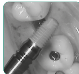
SOSTITUZIONE IMMEDIATA CON NUOVO IMPIANTO