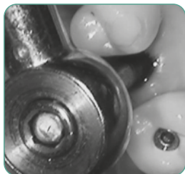
RIMOZIONE IMPIANTO IN AVVITAMENTO ANTIORARIO